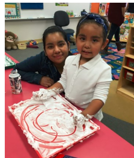
Escribir letras sobre crema de afeitar

Puede que los voluntarios no siempre trabajen en el salón de su niño. Algunas veces sucede que el aprendizaje del niño se interrumpe ante la presencia de sus papás en el salón de clases, así que es probable que les asignemos el trabajar en otro salón de clases ajeno al de su niño. Los voluntarios no imparten lecciones ni manejan asuntos de disciplina. Queremos que su experiencia como voluntario sea una positiva tanto para los padres como para los niños.